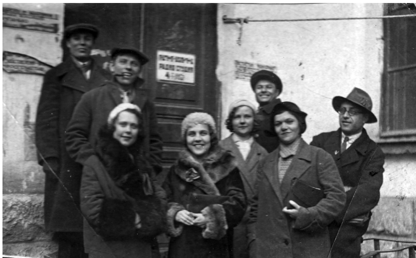
Перед записью на радиостудии. г. Ереван

Хормейстер Ереванского государственного театра оперы и балета (1932–1949), заслуженный артист Армянской ССР (1939), студент Центрального заочного музыкально-педагогического института (1940–1941) 7 , художественный руководитель Ансамбля донских казаков (1949–1950), организатор и руководитель первой Донской вокальной капеллы, Ростовского городского хора мальчиков (1962–1979) и других коллективов, преподаватель и руководитель дирижёрско-хорового отделения Ростовского училища искусств (1951–1967).