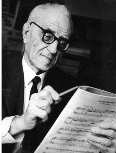
За просмотром партитуры

и предприятиях в годы Великой Отечественной войны награждён медалями «За оборону Кавказа», «За доблестный труд в Великой Отечественной войне 1941–1945 гг.».