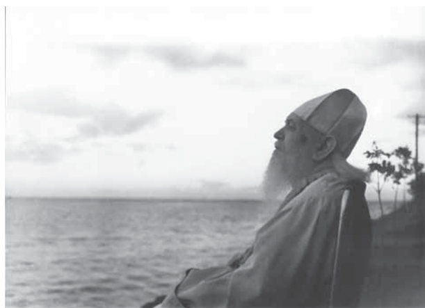
Последние дни земной жизни архиепископа Луки

В день Прощеного воскресения 1960 г. архиепископ Лука произнес свою последнюю проповедь. 11 июня 1961 г., в Неделю всех святых, в земле Российской просиявших, в 6 часов 45 минут утра владыки не стало [1].