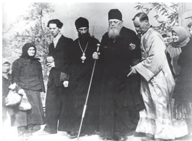
Архиепископ Лука после службы в кафедральном соборе Святой Троицы в сопровождении прихожан

Жестко и открыто боролся с церковными нестроениями архиепископ Лука. И не боялся испортить своей строгостью отношения с паствой, с церковным клиром. Дух человекоугодия был ему чужд — каждый миг своей жизни он предстоял перед Господом, и его помыслы были лишь о том, как бы прославить Бога и соблюсти в чистоте Его Церковь.