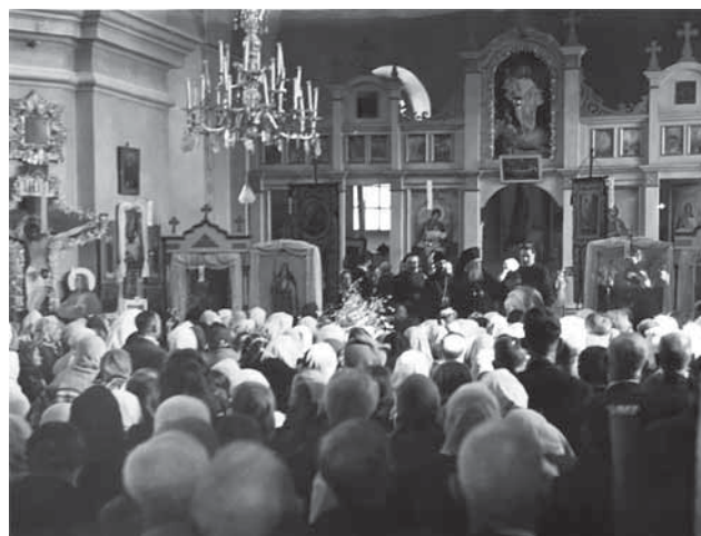
Богослужение в соборе Святой Троицы

Лейкфельд в 1958 г. в Симферополе. Биография обрывается на словах: «В мае 1946 года я был переведен на должность архиепископа Симферопольского и Крымского. Студенческая молодежь отправилась встречать меня на вокзал с цветами, но встреча не удалась, так как я прилетел на самолете. Это было 26 мая 1946 г...».