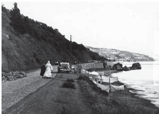
Архиепископ Лука на Черноморском побережье

Все эти запреты неизбежно резко ухудшат материальное положение духовенства, и без того настолько тяжелое, я не имею возможности назначать священников в некоторые приходы, до крайности бедные. Налоги на духовенство увеличиваются.